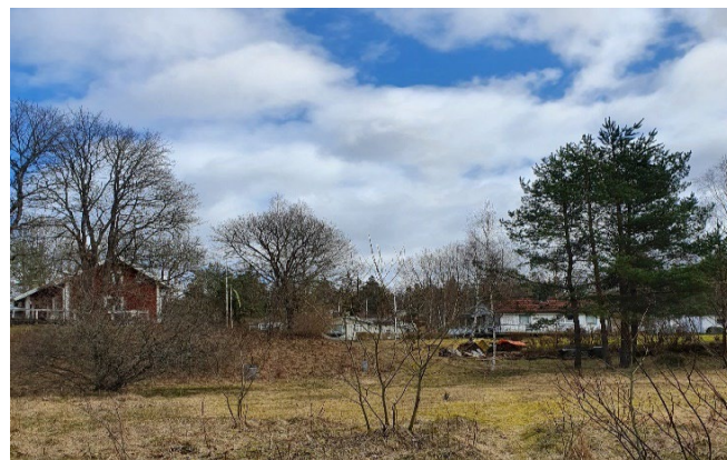
Fotografi från Björsjöhage

De konsekvenser som kan uppstå med att en del av naturmark samt öppet vatten upphävs i detaljplanen och att det finns möjlighet för byggnation i området kommer inte att påverka miljön och sociala konsekvenserna negativt. Utifrån den behovsbedömningen kommer inte en miljöbedömning behövas göras.