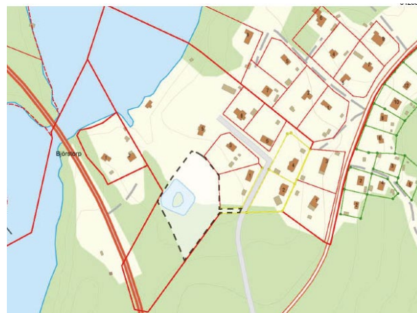
Området som föreslås upphävas